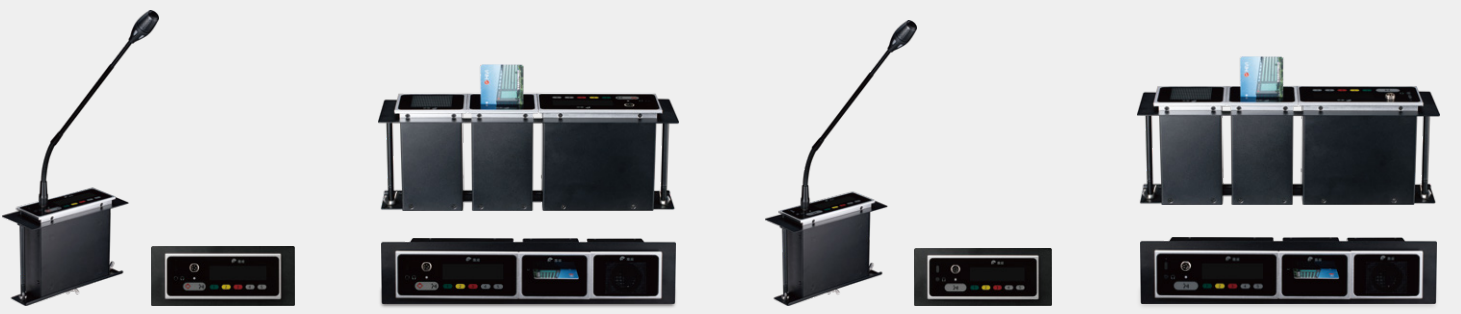
HCS430C 嵌入式有线会议发言主席单元 HCS430CF 嵌入式有线会议全功能主席单元 HCS430D 嵌入式全数字有线会议发言代表单元 HCS430DF 嵌入式全数字有线会议全功能代表单元