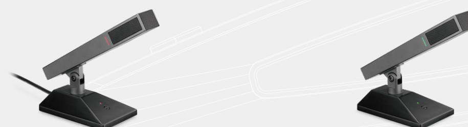
● HCS200D有线数字会议发言单元 ● HCS200P幻象有线会议发言单元