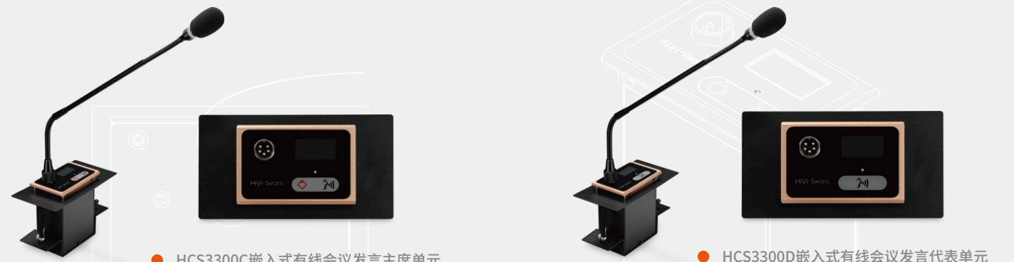
● HCS3300C嵌入式有线会议发言主席单元 ● HCS3300D嵌入式有线会议发言代表单元