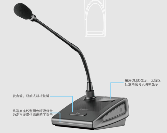
发言键, 轻触式机械按键