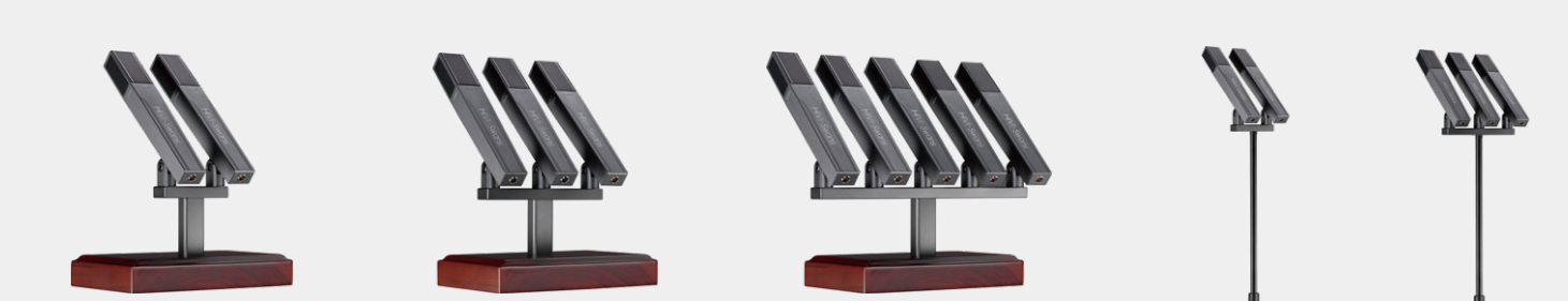
HCS200P-D2 台式双联幻象话筒 HCS200P-D3 台式三联幻象话筒 HCS200P-D5 台式五联幻象话筒 HCS200P-T2 立式双联幻象话筒 HCS200P-T3 立式三联幻象话筒