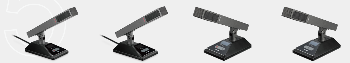
HCS210C 台式有线发言主席 HCS210D 台式有线发言单元 HCS210PC 台式有线发言主席(幻象备份) HCS210PD 台式有线发言单元(幻象备份)